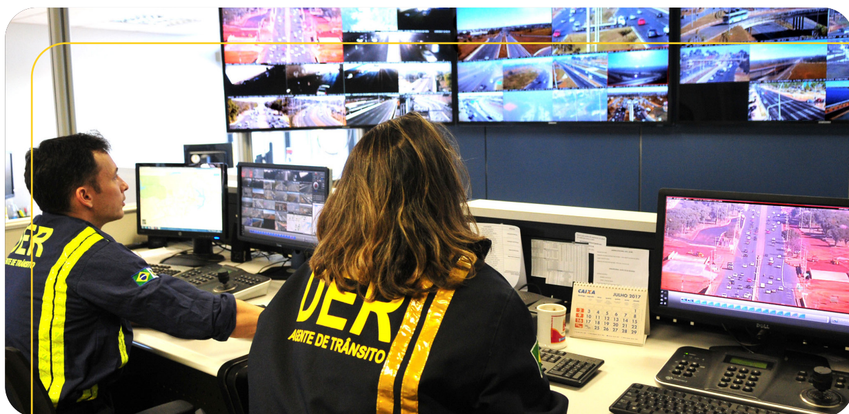
Fiscalização do Centro de Controle Operacional (CCO)

Fomento da utilização de materiais sustentáveis para a realização dos serviços de sinalização horizontal e produção de placas (vidro reciclado como componente da microesfera e plástico reciclado como estrutura das placas rodoviárias)