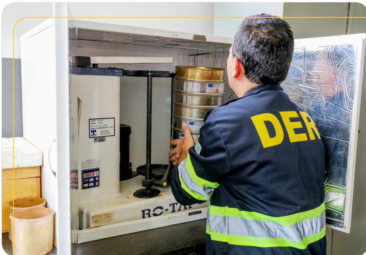
Laboratório de solos e de asfalto

Aquisição de novos equipamentos para a realização dos serviços de sinalização horizontal e fabricação de placas